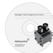
CD-Rom (en inglés)

El CD-ROM que se suministra incluye dos videos y dos presentaciones en Power Point sobre los principios y aplicaciones de la tecnología de pila de combustible.