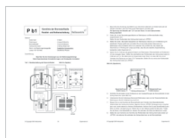
Guía del profesor

Tres libros de texto contienen la guía de profesor para más de 20 experimentos de física, química, tecnología, hojas de trabajo con pequeños artículos y ejercicios, instrucciones detalladas con información sobre experimentos y posibilidades para el análisis y la interpretación de los datos medidos.